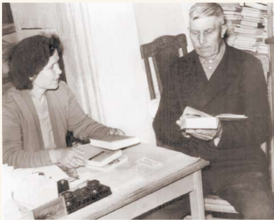
В сельской библиотеке. 60-е годы