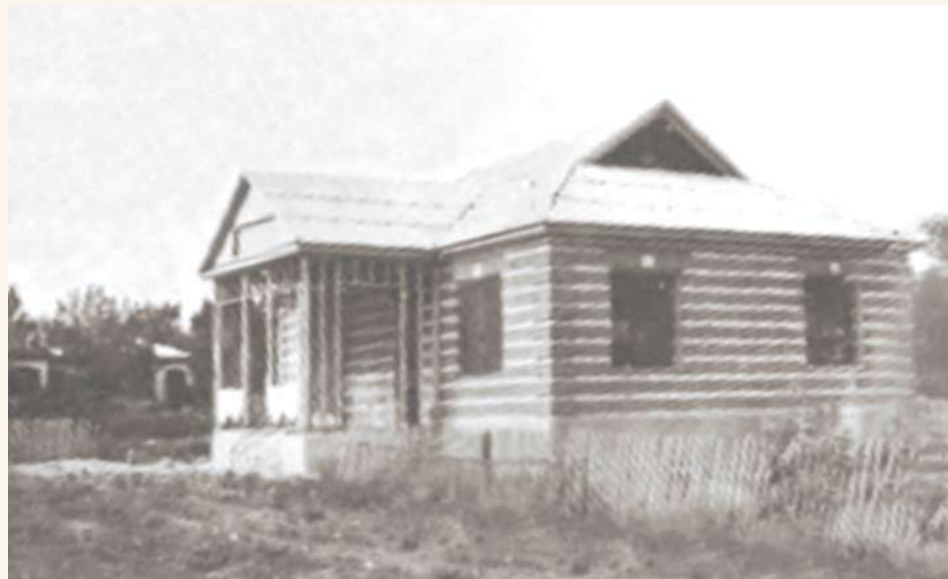
Здание сельской библиотеки, построенное в 1968 году

Библиотека была очень мала: две тесных комнатухи. Там стояли грубо сколоченный стол, почерневший шкаф 20-х годов и фанерный стеллаж, сделанный сельским плотником. На окнах вместо