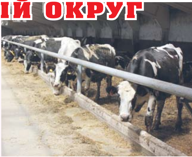
ных направлений, обозначенных Губернатором Ставрополя перед агропромышленным комплексом региона.

Увеличение производства молока — одно из приоритет-