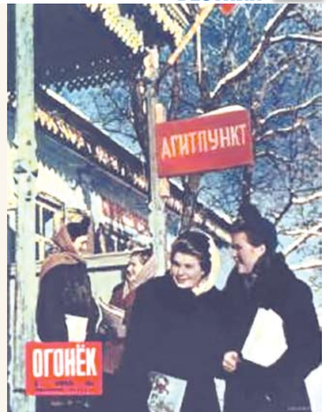
Обложка журнала «Огонёк» за февраль 1954 года