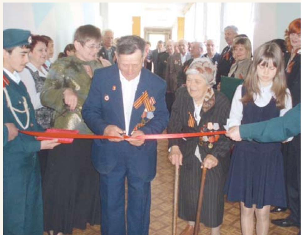
На открытии школьного музея, 2007 год