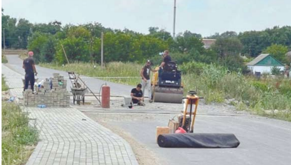
Асфальтовое покрытие и пешеходную дорожку рядом с прудом вблизи села Казинка в Шпаковском муниципальном округе восстанавливают по просьбе жителей.

Подрядная организация в рамках гарантийных обязательств уже приступила к ремонту просевшего участка плотины протяжённостью около 50 метров. Что уже сделано: восстановлены геометрические параметры плотины, облицован мокрый откос железобетонными плитами, восстановлен паводковый водосброс.