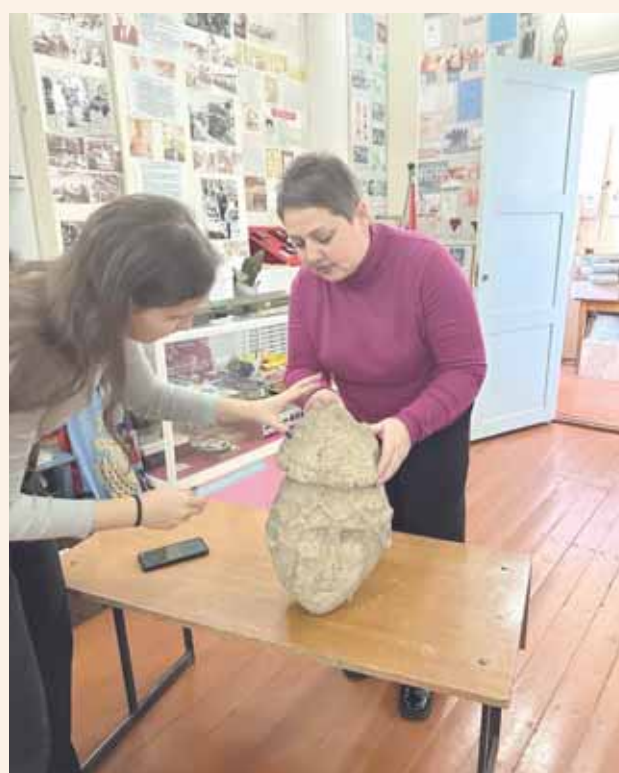
Атрибуция половецкой головы в историко-краеведческом музее

сов. Наиболее развито было у половцев ремесло камнетёсов, занимавшихся изготовлением каменных статуй.