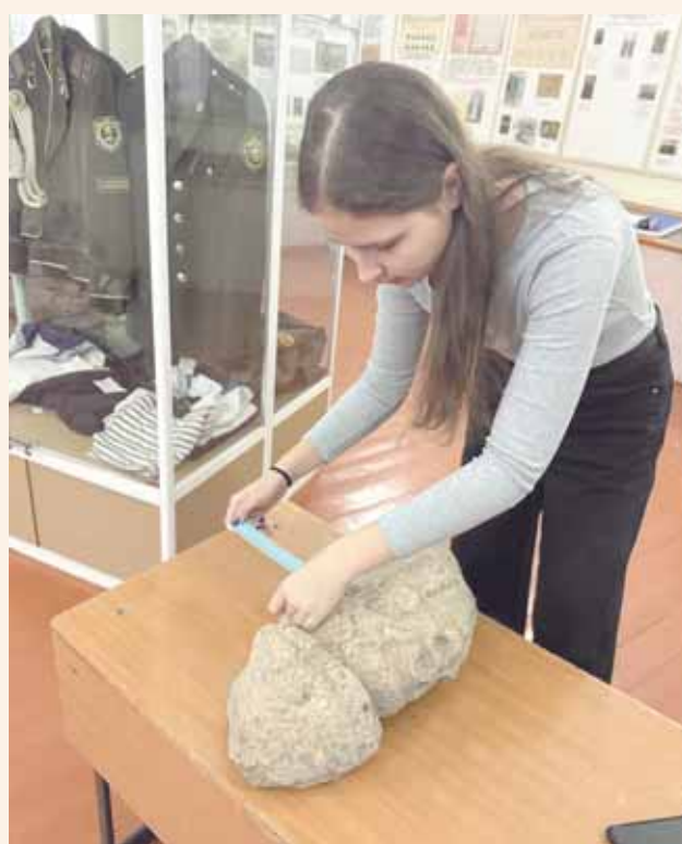
Атрибуция половецкой головы в историко-краеведческом музее