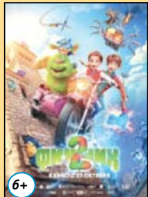
Финник 2 18,19 октября 11.40 20, 21, 22 октября 9.30