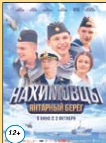
Нахимовцы. Янтарный берег 18,19 октября 13.20 20, 21, 22 октября 11.10/14.50 (Пушкинская карта)