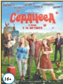
Сердцеед 18,19 октября 19.20 20, 21, 22 октября 16.30