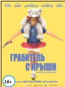
Грabitель с крыши 18,19 октября 17.00 20, 21, 22 октября 18.20