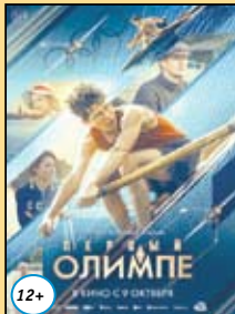
Первый на Олимпе 18,19 октября 15.00 20, 21, 22 октября 12.50 (Пушкинская карта)