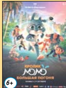
Кролик Момо. Большая погоня 18,19 октября 10.00

Билеты можно приобрести в кассе, а также на сайте kinorossia.com. Телефон: 8-865-53-6-39-25