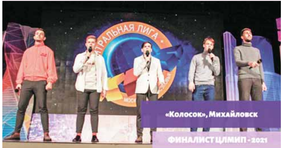
Команда КВН «Колосок» города Михайловска стала чемпионом Центральной лиги КВН Москвы и Подмосковья сезона 2021 года!

В финале наши ребята соперничали с командами «Омская сборная» из Омска, «Юриен» СОГУ им. К. Л. Хетагурова из Владикавказа и «Мастер Муси РЭУ им. Г. В. Плеханова»,