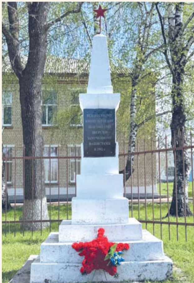
Памятник юному партизану, зверски замученному фашистами в 1942 г., село Казинка