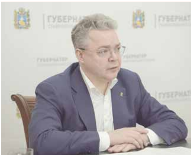
Губернатор Владимир Владимиров провёл видеоселекторное совещание с руководителями региональных органов власти, посвящённое реализации на Ставрополье Указа Президента России от 23 января 2024 года о мерах социальной поддержки многодетных семей.