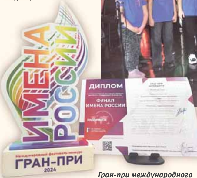
Гран-при международного фестиваля-конкурса 2024 года

Конкурсы следовали за конкурсами. В копилке наград победы в городах Невинномысск, Железноводск, Москва, Сочи, Краснодар, Казань и других. Наш детский хор уже приглашают на серьёзные мероприятия. Коллектив «Злато»