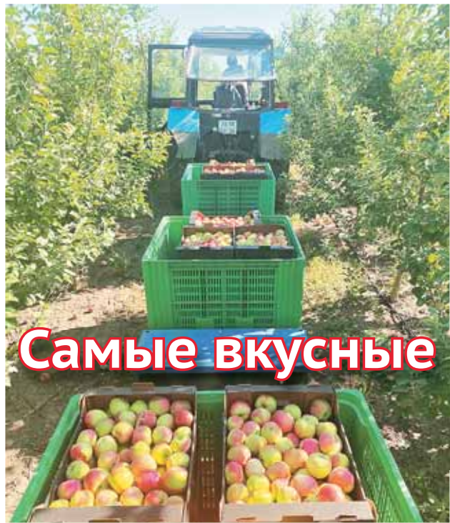
Самые вкусные Первый урожай летних яблок собрали участники эксперимента по созданию садов суперинтенсивного типа в личных подсобных хозяйствах Шаповского муниципального округа.