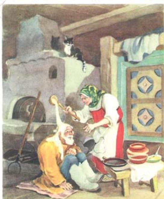
1955 г. «Советский художник». Картон. Размер: 14,5х10,5 см. На лицевой стороне изображение деда и бабушки у печи. (Русская народная сказка «Три зятя»). Сохранность: потёртости, краски утратили яркость, дырка по центру.