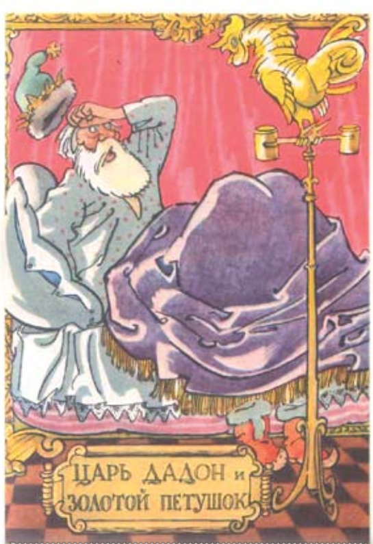
1956 г. «Советский художник». Картон. Размер: 14,5х10,5 см. На лицевой стороне изображение царя Дадона с золотым петушком. (А. Пушкин, «Сказка о золотом петушке»). Сохранность: потёртости, краски утратили яркость.