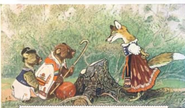
1955 г. «Советский художник». Картон. Размер: 14,5х8,5 см. На лицевой стороне изображение: медвежата и лиса беседуют у пня. (Венгерская народная сказка «Два жадных медвежонка»). Сохранность: потёртости, краски утратили яркость, обрезана внизу.