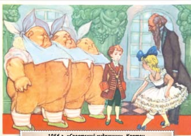
1956 г. «Советский художник». Картон. Размер: 14,5х10,5 см. На лицевой стороне изображение трёх толстяков и их наследника Тутти. (Ю. Олеся, «Три толстяка»). Сохранность: потёртости, краски утратили яркость.