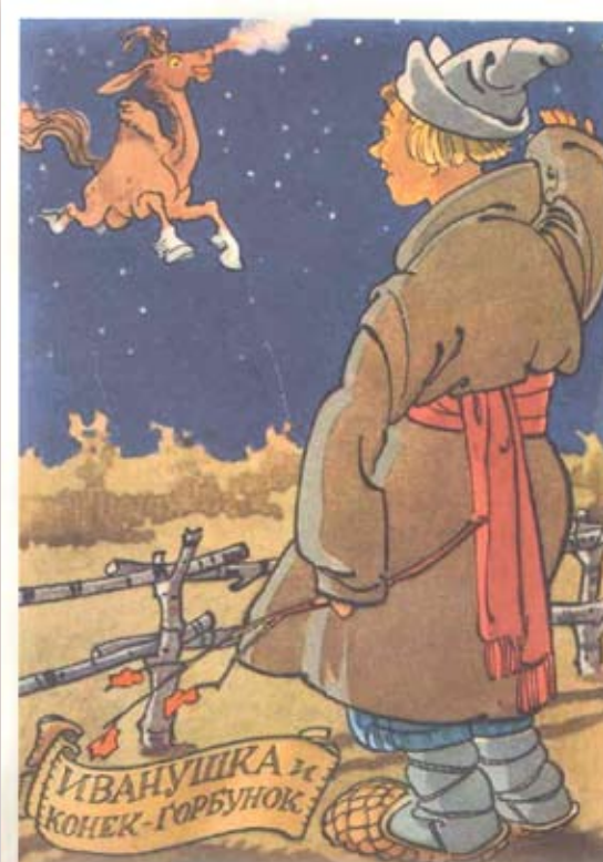
1956 г. Издательство «Советский художник». Картон. Размер: 14,5х10,5 см. На лицевой стороне изображение Иванушки и конька-горбунка. (П. Ершов, «Конёк-горбунок»). Сохранность: потёртости, краски утратили яркость.