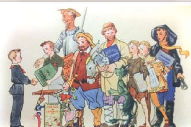
1961 г. «Советский художник». Картон. Размер: 14,5х10,5 см. На лицевой стороне изображение ученика с героями из сказок. Сохранность: потёртости, краски утратили яркость.