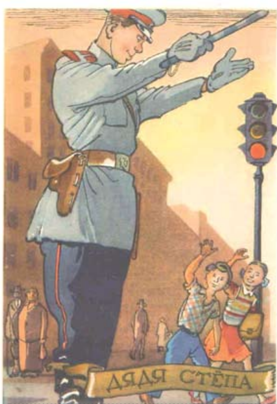
1956 г. Издательство «Советский художник». Картон. Размер: 14,5х10,5 см. На лицевой стороне изображение дяди Степы у светофора. (С. Михалков, «Дядя Степа»). Сохранность: потёртости, краски утратили яркость, обрезан нижний правый угол.