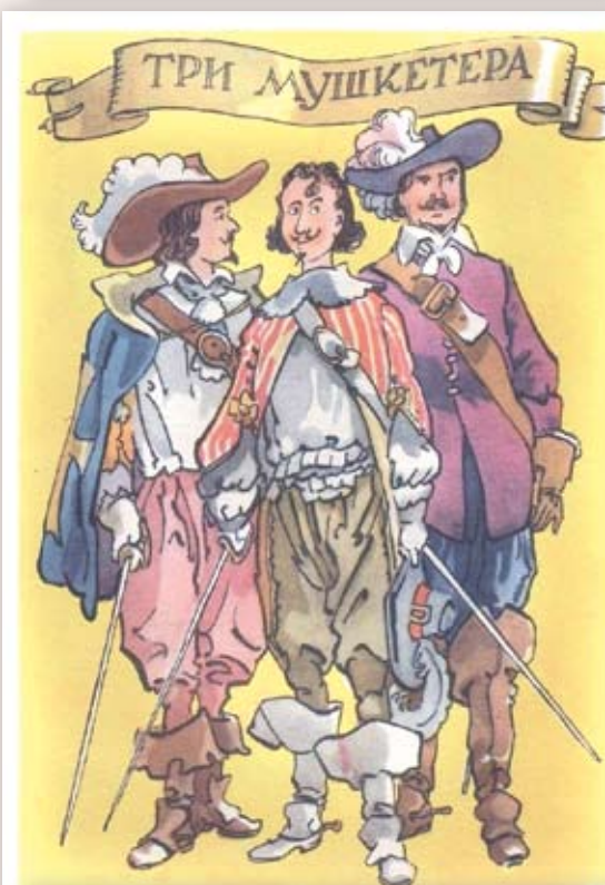
1956 г. Издательство «Советский художник». Картон. Размер: 14,5х10,5 см. На лицевой стороне изображение трёх мушкетеров. (А. Дюма, «Три мушкетера»). Сохранность: потёртости, краски утратили яркость.