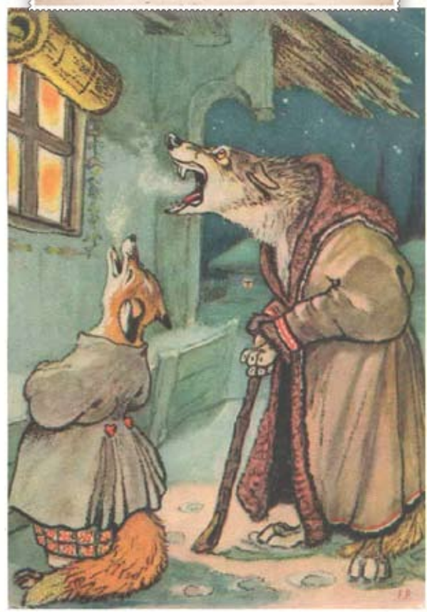
1955 г. «Советский художник». Картон. Размер: 14,5x10,5 см. На лицевой стороне изображение волка и лисы, которые поют под окном. (Народная сказка «Волчья песня»). Сохранность: потёртости, краски утратили яркость.