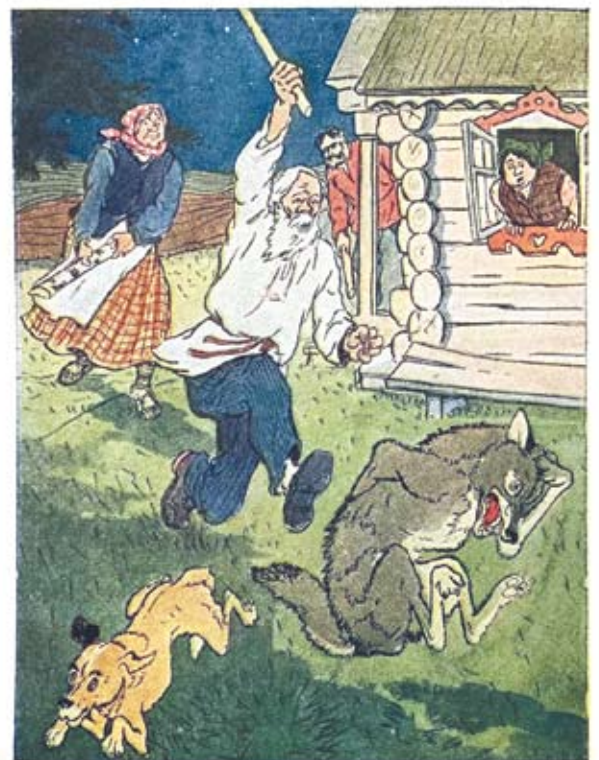
1955 г. «Советский художник». Картон. Размер: 14,5x10,5 см. На лицевой стороне изображение старика, который гонит со двора собаку и волка. (Белорусская народная сказка «Собака и волк»). Сохранность: потёртости, краски утратили яркость, залом в нижнем левом, правом углу.

Газета «Шпаковский вестник» публикует несколько изображений и описаний открыток из «детской» коллекции музеев Сенгилеевского. Они интересные, праздничные и прекрасно отражают дух ушедшей эпохи.