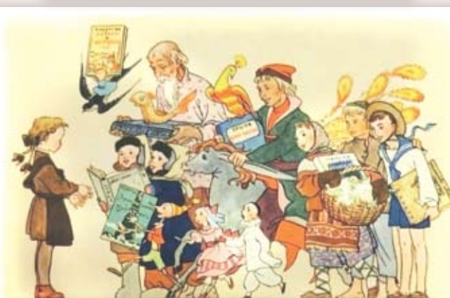
1961 г. «Советский художник». Картон. Размер: 14,5х10,5 см. На лицевой стороне изображение ученицы с героями из сказок. Сохранность: потёртости, краски утратили яркость.