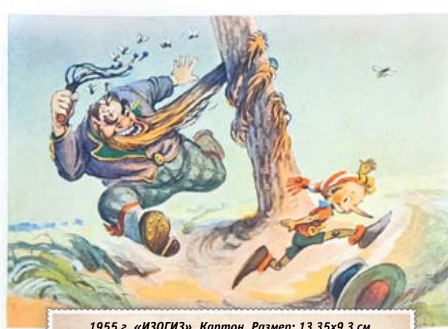
1955 г. «ИЗОГИЗ». Картон. Размер: 13,35х9,3 см. На лицевой стороне изображение Карабаса Барабаса, догоняющего Буратино. (Л. Толстой, «Золотой ключик»). Сохранность: потёртости, краски утратили яркость, открытка обрезана.