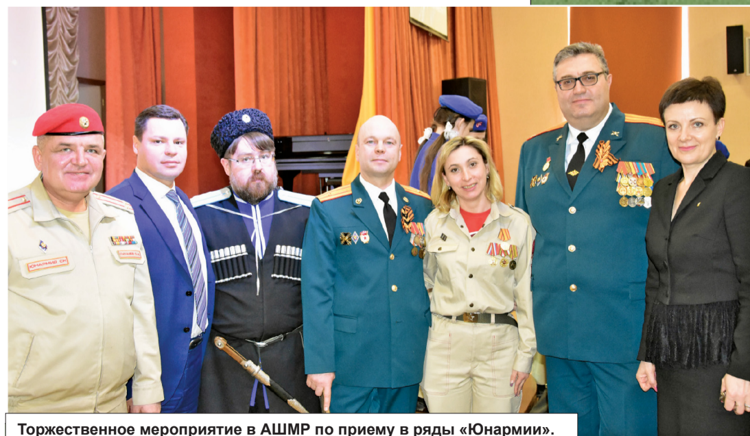
Торжественное мероприятие в АШМР по приему в ряды «Юнармии».