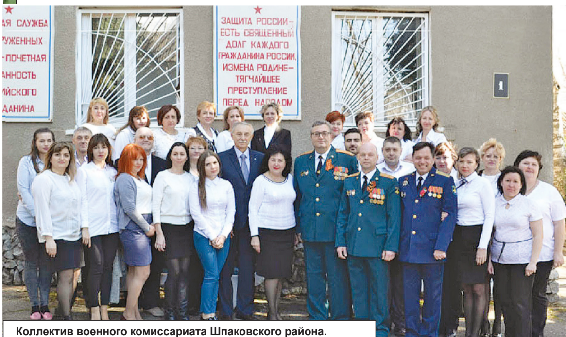
Коллектив военного комиссариата Шпаковского района.

- Что Вы можете сказать призывникам, которые всеми правдами и неправдами дела-