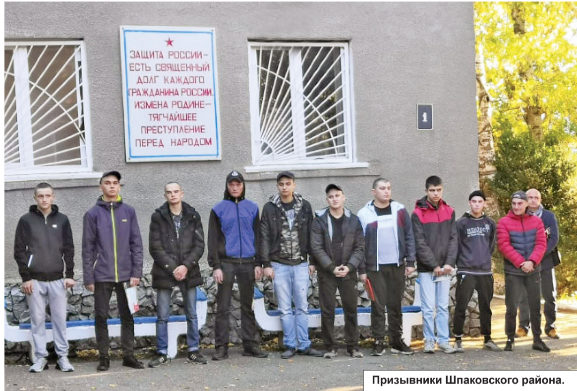
Призывники Шпаковского района.