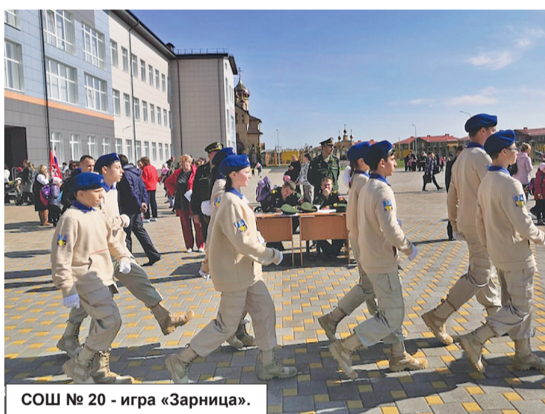
СОШ № 20 - игра «Зарница».

- Да, изменилась, и существенно. Молодые люди хотят служить, так как в нашей стране сейчас ведется активная и разноплановая работа по военно-патриотическому воспитанию молодежи. Изменилась во многом в лучшую сторону ситуация и в самой армии. Кроме того, в федеральные законы «О воинской обязанности и военной службе», «О государственной службе» и «О муниципальной службе» были внесены изменения, согласно которым непрошедшие военную службу, не имея на то законных оснований, не могут быть приняты на работу в государственные и муниципальные учреждения, в правоохранительные