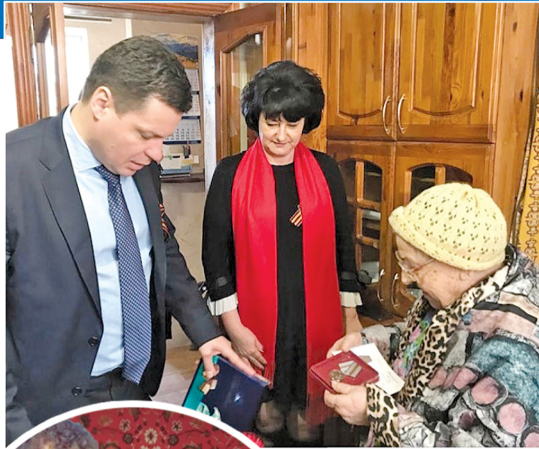
Награждение в с. Надежда.