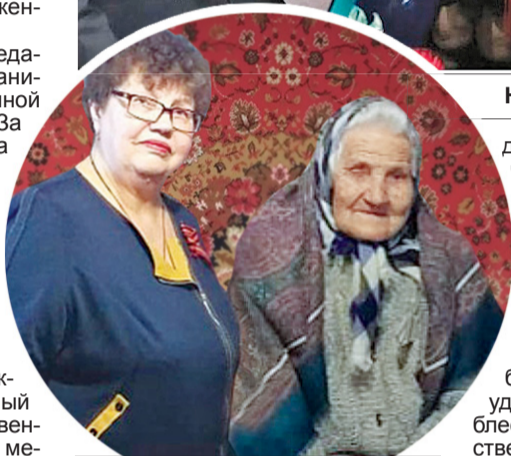
Награждение в с. Сенигилеевском.

доблесть», «За трудовое отличие», «За оборону Ленинграда», «За оборону Москвы», «За оборону Одессы», «За оборону Севастополя», «За оборону Сталинграда», «За оборону Киева», «За оборону Кавказа», «За оборону Советского Заполярья», а также лица, имеющие знак «Жителю блокадного Ленинграда» либо удостоверение к медали «За доблестный труд в Великой Отечественной войне 1941 - 1945 гг.»; - лица, проработавшие в период с 22 июня 1941 г. по 9 мая 1945 г. не менее шести месяцев, исключая