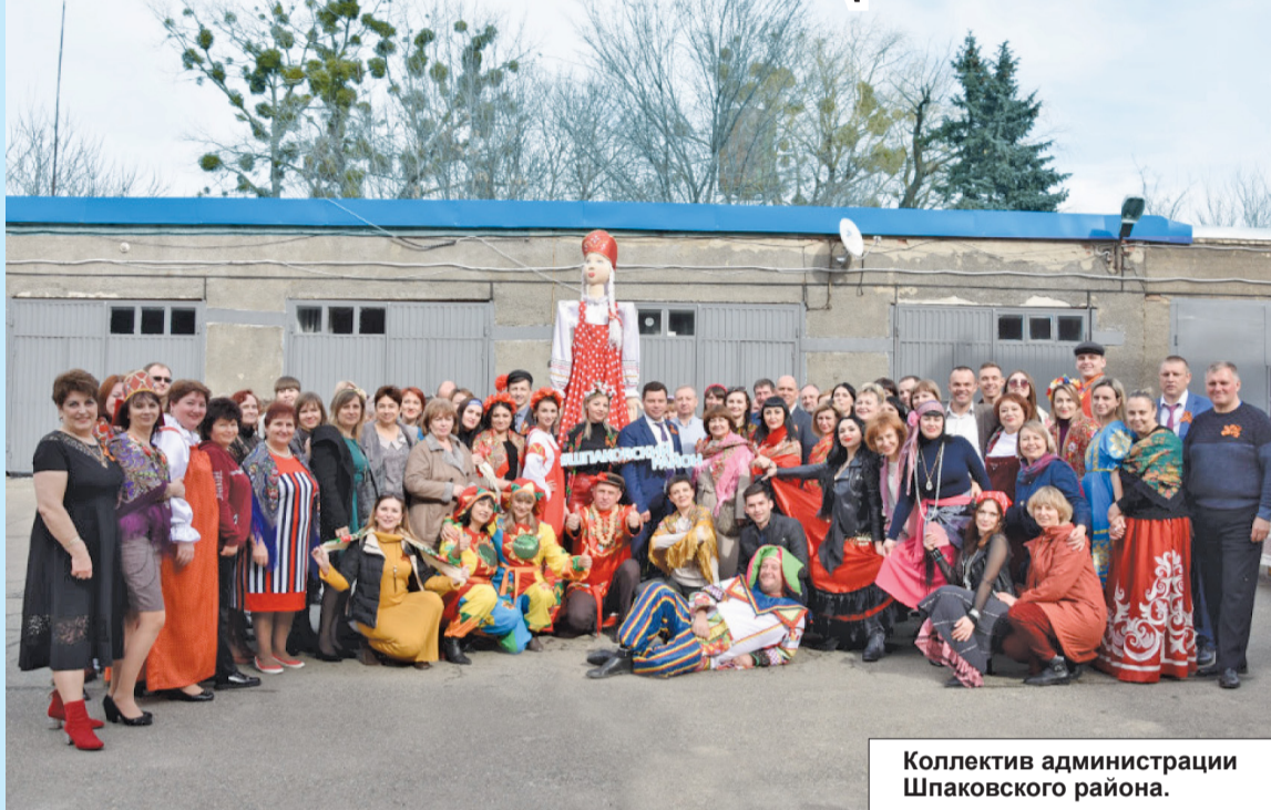
Коллектив администрации Шпаковского района.

Не совсем обычно отметили Масленицу работники администрации Шпаковского муниципального района.