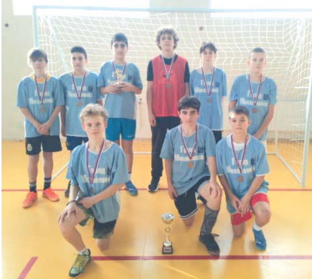
В спортивном зале СОШ № 23 города Михайловска 31 января - 1 февраля прошёл Открытый турнир по футзалу, посвящённый 83 годовщине освобождения Ставрополя от фашистской оккупации.

В соревнованиях участвовали пятнадцать команд в двух возрастных группах. Все игры прошли в упорной борьбе, спортсмены продемонстрировали хорошую футбольную